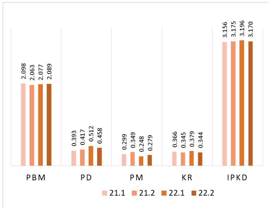
Gambar 3. 2 Rata-rata IPKD selama Tahun Akademik 2021/2022 hingga 2022/2023

Table 3.3 menunjukkan jumlah dan persentase dosen berdasarkan kelompok IPKD pada TA 2022/2023. Diketahui bahwa, IPKD tertinggi pada Genap 2022/2023 yaitu antara 3.5 hingga 4 dimiliki oleh 27% dosen. Sejumlah 47% dosen memiliki IPKD antara 3 hingga 3.5. Selanjutnya terdapat 23% dosen memiliki IPKD antara 2.5 hingga 3. Detail nama-nama dosen beserta ranking IPKD disajikan di Tabel 3.4